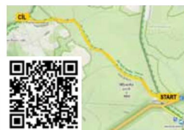
Trasa: Hadí stezka

Trasa začíná u přístřešku na Gerlově Hutí žlutým značením a pokračuje po něm celé dva kilometry směrem na severozápad. Po této trase je možné se vrátit zpět na parkoviště na Gerlově Hutí anebo pokračovat 5 km nejprve po zelené a pak po modré turistické značce do Železné Rudy.