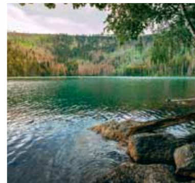
Foto: Datlíkova stezka - Černé jezero