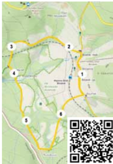
Trasa: NS Brčálník

Výchozí bod se nalézá poblíž vlakové zastávky ČD Brčálník, kde je na informačním panelu instalována mapa s jednotlivými zastávkami. Pohyb k jednotlivým bodům je veden jednosměrně. Od úvodního panelu trasa postupuje zastavěnou částí Brčálníku k odbočce doleva, kde je nad železniční tratí panel s panoramatickým popisem pohledu na část Královského hvozdu s Jezerní horou. Dále trasa pokračuje po polní cestě kolem chat, za kterými