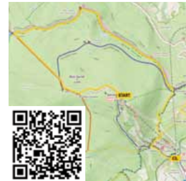
Trasa: Datlíkova stezka