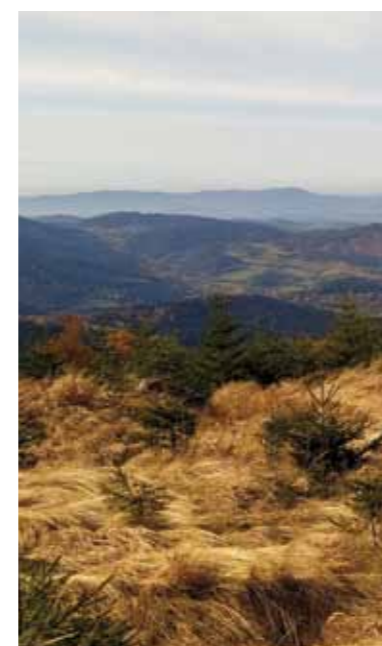
Foto: NS Hojsova Stráž - Výhled z Můstku

Naučná stezka začíná u místního kostela (Z1) v centru obce. Společně s modrou turistickou značkovou jde podél hlavní ulice a po cca 200 m odbočuje před Šumavským orlojem doleva nahoru směrem k vyhlídce Liebeshöhe. Ale po 350 m odbočuje doleva k hlásce (Z2). Zde je trasa ukončena a vrací se zpět. Po cca 250 m odbočuje doleva na Liebeshöhe, kde na vyhlídce trasa opět končí (Z3) a vrací se zpět do Hojsovy Stráže. Trasa pokračuje po chodníku jako modrá turistická značka. Po cca 400 m před chatou Šumava odbočuje stezka vpravo po vlastním značení dolů k Zelenskému potoce a bývalému Rumpelovu mlýnu (Rumpelmühle (Z4)). Poté trasa prudce stoupá k rekreačním objektům a dále na jižní straně (Z5). Prudký výstup je odměněn nádhernými výhledy na Královský hvozd. Ostří a vrchol Špičáku s rozhlednou. Stoupání pokračuje ještě kousek na jižní straně, pak cesta zvolňuje a pokračuje až k bývalé chatě na Prenetu. Odtud vede trasa ke kapli sv. Kunhuty (Z6), pak kousek zpět a dále pokračuje souběžně s červeným značením okolo vrcholu Prenetu na Můstek (Z7, Z8). Cestou jsou opět nádherné výhledy na Královský hvozd, Nyrskou přehradu i na vnitrozemí Klatovska. Od Můstku po modré k (Z9), okolo další tabule (Z10) k zámečku a cestou ještě odbočí doprava k bývalému pivovaru (Z11), odkud se vrací do Hojsovy Stráže.