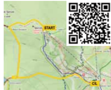
Trasa: Zajícova stezka

DOSTUPNOST: vlakem (stanice Špičák) i autobusem (zastávka Železná Ruda, Stella) do obce Špičák, poté pěšky cca 500 m do areálu Ski&Bike Špičák.