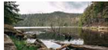
Foto: Zajícova stezka - Čertovo jezero

DOSTUPNOST: vlakem (stanice Špičák) i autobusem (zastávka Železná Ruda, Stella) do obce Špičák, poté pěšky cca 500 m do areálu Ski&Bike Špičák.